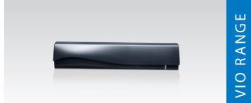
레이더 감지 영역 4 m × 2 m 적외선 감지 영역 2.2 m × 25 cm @ 2.2 m