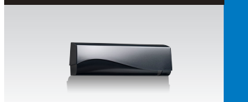
VIO-M 슬라이딩 자동문의 열림/닫힘 기능에 적합한 마이크로웨이브 버전 센서